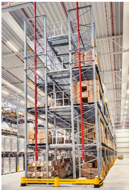
Dank eines Doppelregals mit integrierten Wartungsgängen können bei der Wollenhaupt Vanille GmbH Warenproben entnommen werden, ohne Paletten auslagern zu müssen.

Zur Lagerung der wertvollen Vanille-Rohstoffe setzt das Unternehmen auf herkömmliche Palettenregale – allerdings mit einer Besonderheit: Von den eingelagerten Produkten müssen immer wieder Muster gezogen werden. Doch wäre es viel zu aufwendig dazu jedes Mal die entsprechende Palette mit dem Stapler aus- und wieder einzulagern. Galler realisierte daher ein Doppelregal mit jeweils einem Wartungsgang pro Lagerebene zwischen den Regalzeilen. Die 1,1 Meter breiten Gänge sind mit verzinkten Gitterrosten belegt, sodass die Wirkung der Sprinkleranlage nicht behindert wird. Der Zugang auf die in den Höhen 2,25, 4,50, 6,75 und 9 Metern angebrachten Gänge erfolgt über eine Wangentreppenanlage mit Zwischenpodesten, die ebenfalls von Galler geliefert wurde. Sie teilt das 44,9 Meter lange Regal in der Mitte. Dank