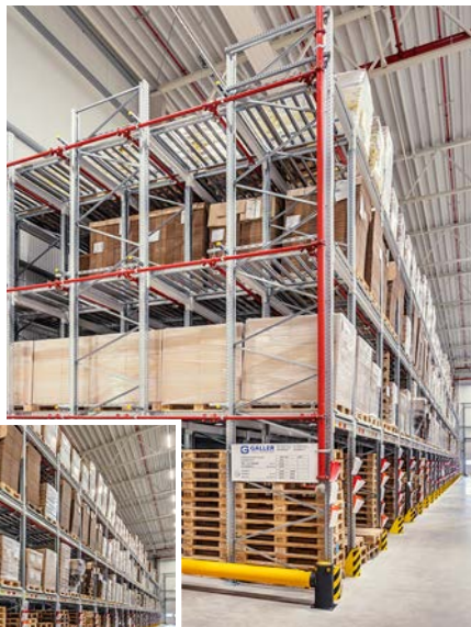
Ein rund 54 Meter breites Einschubregal ermöglicht die hochkompakte Lagerung von Verpackungen und Paletten.

und 6,3 Meter tiefe Regalblock bietet auf vier Lagerebenen Platz für insgesamt 1.020 Europaletten. Aufgebaut ist die Anlage aus den Omega-Palettenregalen von Galler: Das flexible System ermöglicht vielseitige Lösungen für die unterschiedlichsten Anforderungen. Für das neue Lager von Wollenhaupt Vanille wurden die Omega-Rahmen mit Rollenbahnen kombiniert, die mit einem Gefälle von